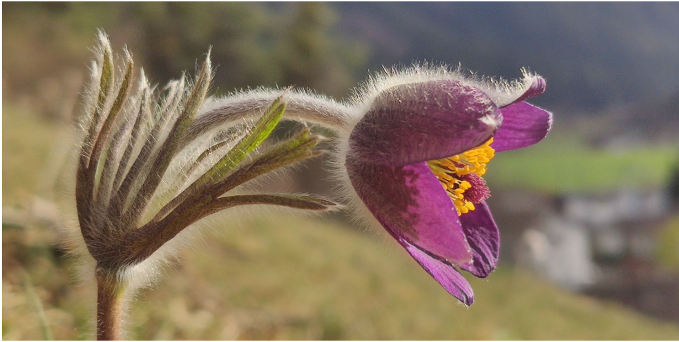
Berg-Anemone ( Pulsatilla montana ): bei Domat/Ems.