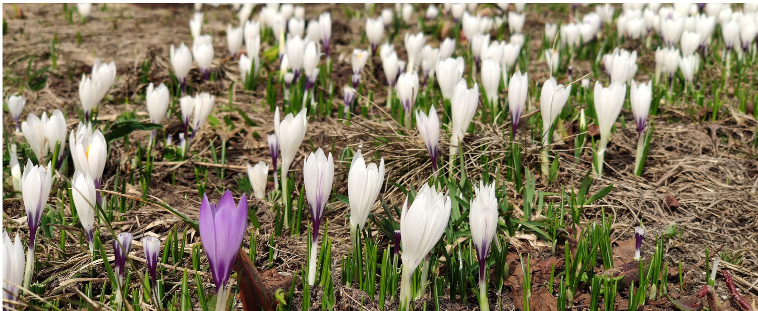
Frühling in Davos: Frühlings-Krokus ( Crocus albiflorus ).